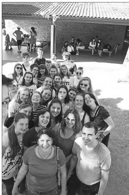
Teilnehmer der Taizé-Fahrt mit begleitenden Lehrern